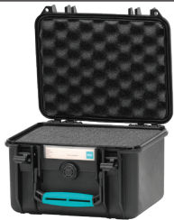
* cubed foam