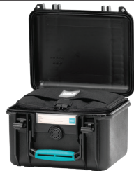
* interior bag