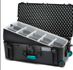
* second skin