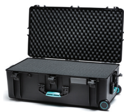
* cubed foam